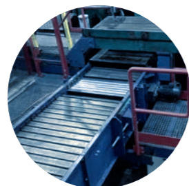
CONVOYEURS À TABLIERS