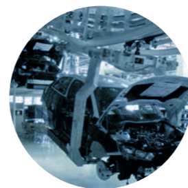
CONVOYEURS DE MANUTENTION

Entecom est le fabricant total avec une mission claire: «Nous construisons une relation client à long terme, en écoutant, en proposant des solutions et en améliorant les processus qui permettent au client de réaliser des économies futures.»