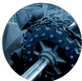
ELÉVATEUR À GODETS