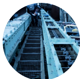
TRANSPORTEURS À CHAÎNE